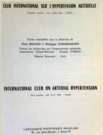
Figure 1 – Les Actes de 1965.