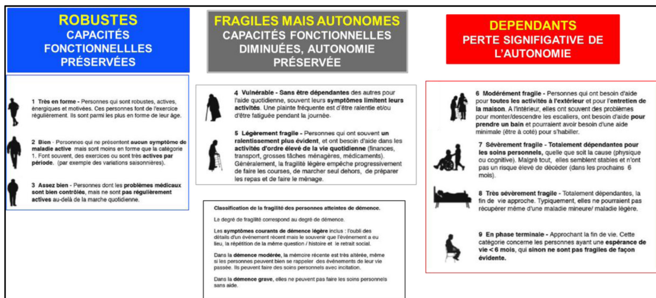
Figure 2 Évaluation de la fragilité par le Score de Fragilité Clinique ( Clinical Frailty Scale ) [23].